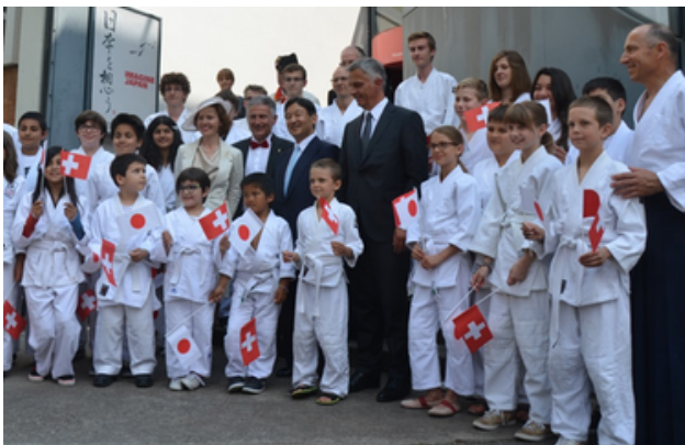
Ci-contre, nos aikidokas du premier voyage en juin 2014 avec le Président de la Confédération Didier Burkhalter et le Prince du Japon Naruhito

Kinder sind unsere Zukunft, also investieren wir in sie, indem wir ihnen eine qualitativ hochwertige und erlebnisreiche Ausbildung bieten!